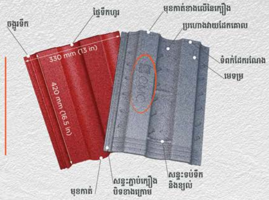
ប្រភេទ ក្លីតូច - Roman