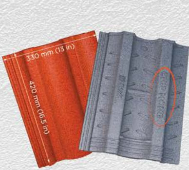
ប្រភេទ ក្លាស៊ិក - Classic